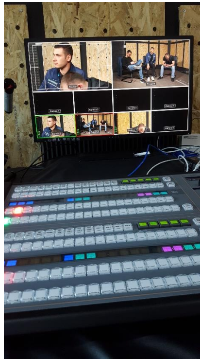
Figure 2: Mikser Video