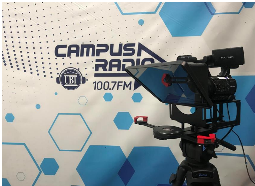
Figure 9: Pajisje në UBT – teleprompter