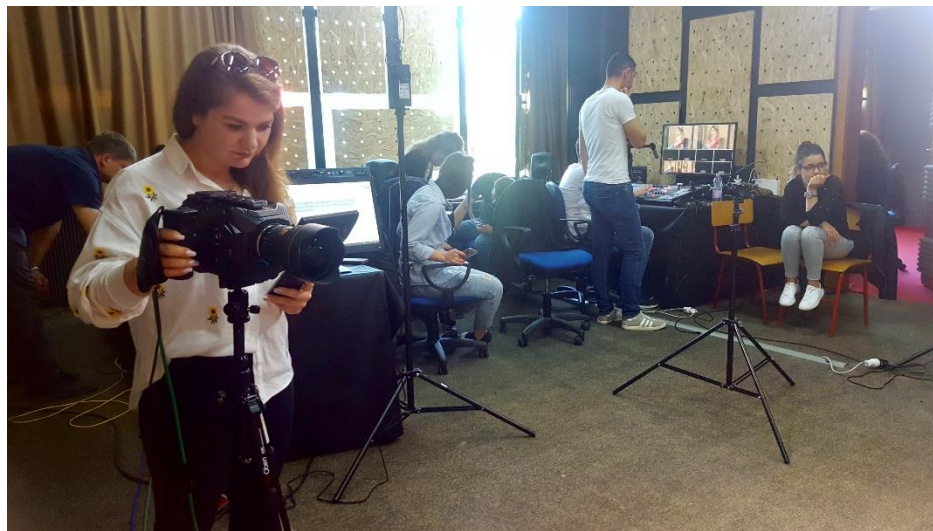
Figure 3: Studio në UAMD

Tenderi për pajisjet është bërë veçmas nga librat teknikë të planifikuar për t'u blerë. Librat teknikë do të jenë literatura e nevojshme dhe do t'u ofrohen studentëve të MDTV në bibliotekë. Librat teknikë janë gjithashtu të nevojshëm për materialet mësimore që do të përdoren nga anëtarët e stafit akademik në modulet dhe programin PM. Lista e blerjeve të planifikuara të librave gjendet në Raportin 2.3.6.