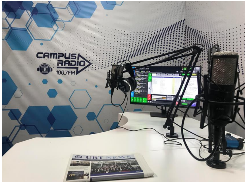
Figure 8: Pajisje në UBT – Mikrofon