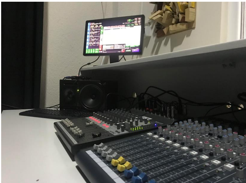
Figure 7: Pajisje në UBT –audio mix