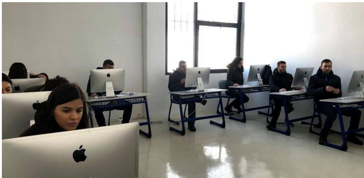
Figure 4: Pajisjet e blera në UP

Përsa i përket blerjes së literaturës, në UP është përgatitur një listë me 30 libra ndërkombëtarë, në gjuhën angleze, për mbështetjen e kurrikulave të sponsorizuara nga projekti DIMTV. Prokurimi i librave do të paraqitet në Raporti 2.3.6.