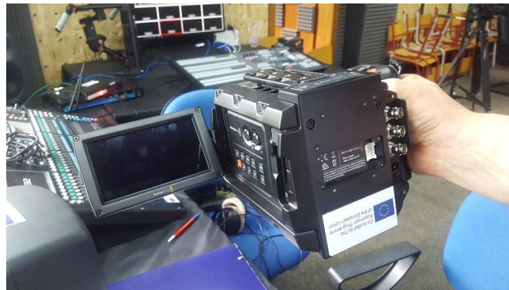
Figure 1: Kamera

Fotografitë më poshtë tregojnë disa nga pajisjet e sapo blera: