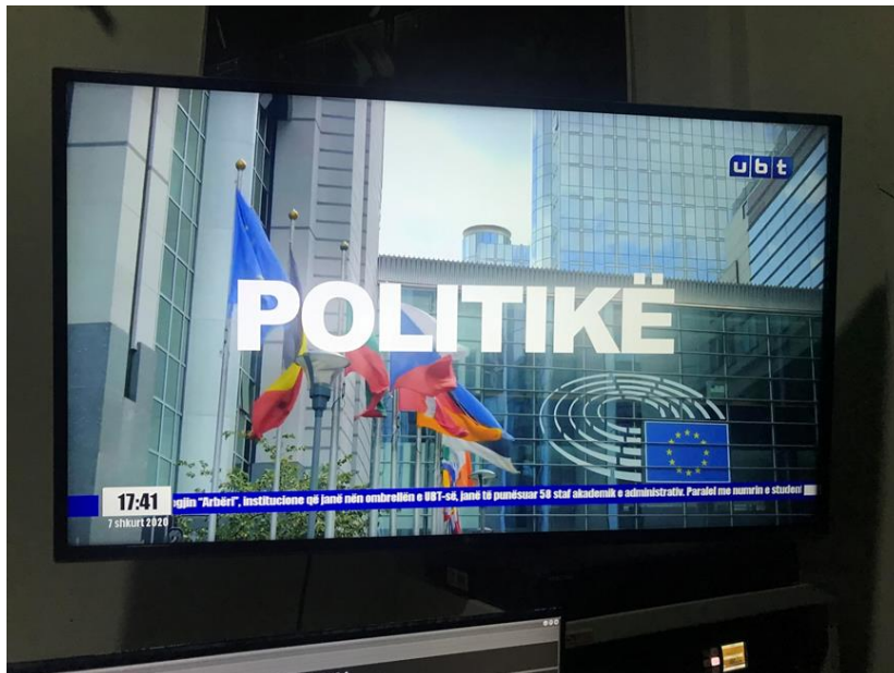
Figure 5: TV Set nga pajisjet e blera në UBT.

Disa nga pajisjet janë prezantuar nëpërmjet fotografive si mëposhtë: